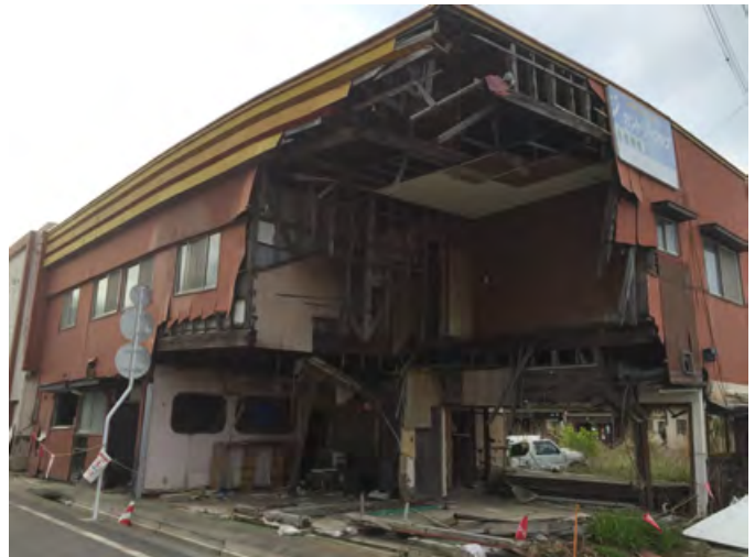
写真：2015年の富岡駅付近の住宅。住民が避難しているため、津波被害も片づけられないままに。

今回のフィールドワークでは、被災地の視察とともに、避難生活・福島第一原発収束作業の実態・復興のための努力などを当事者に伺い、東京で学ぶ私たちに何ができるのかを一緒に考えます。一度、福島へ足を運んでみませんか。