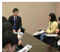
(写真・昨年、山添拓参院議員と)

安倍首相は、「日米同盟第一」といって、「アメリカ・ファースト」のトランプ政権といっしょに戦争ができるよう、日本を変えようとしています。一方で安倍政権に対決する市民と野党の共闘が進展中。安倍政権に代わる構想の展望を、野党共闘の提唱者・日本共産党の国会議員に直接聞きます。