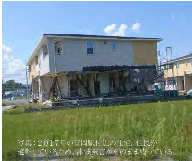
写真：2017年の富岡駅付近の住宅。住民が避難しているため、津波被害がそのまま残っている。

今回のフィールドワークでは、被災地の視察とともに、避難生活の実態・復興のための努力などを当事者に伺い、東京で学ぶ私たちに何ができるのかを一緒に考えます。一度、福島へ足を運んでみませんか。